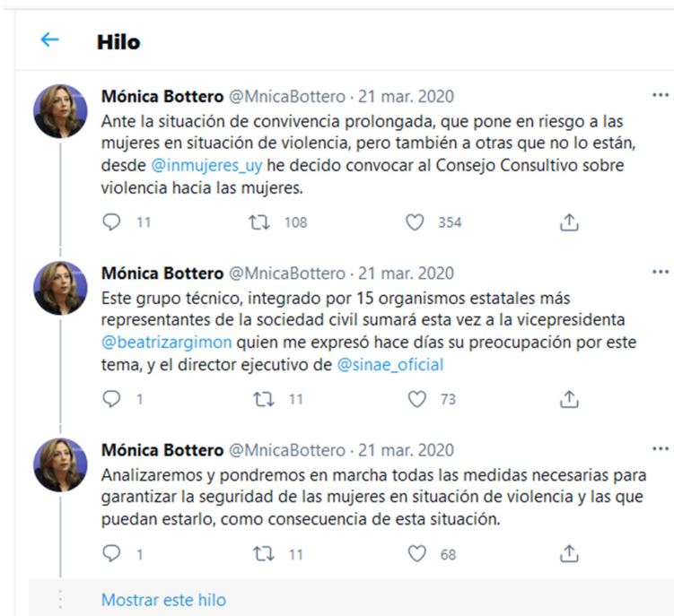
Figura 3. Captura de pantalla del tuit de Mónica Bottero anunciando medidas.

- Mónica Bottero publicó un tuit para informar sobre la convocatoria al Consejo Consultivo sobre Violencia hacia las Mujeres, y éste fue citado por varios medios, como Montevideo Portal (21/3, N°8) y El País (22/3, N°10).